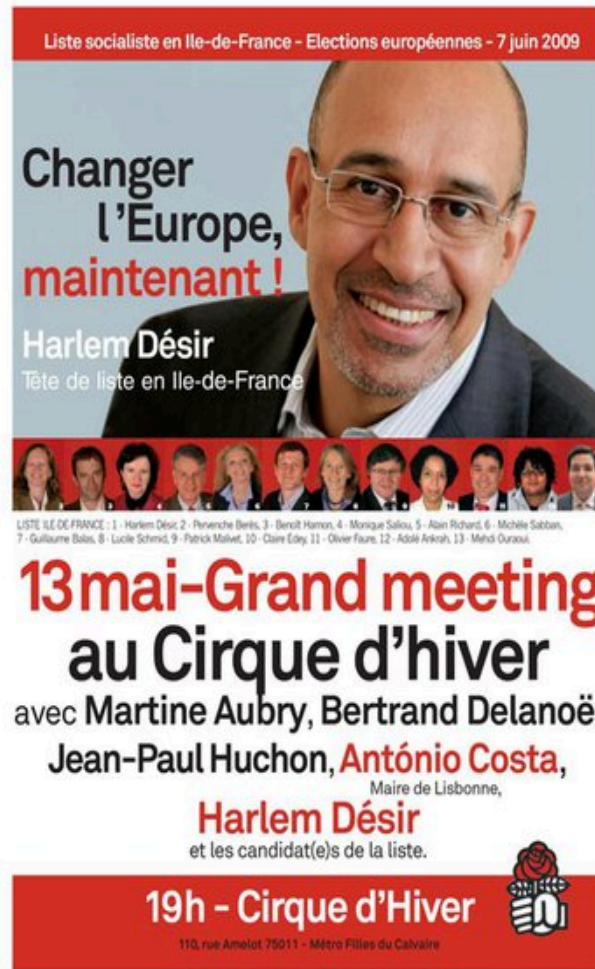
PHOTO DE GAUCHE : Slogan du PS aux élections européennes du 7 juin 1979 : "CHANGER L'EUROPE !" ===== PHOTO DE DROITE : 30 ans après, jour pour jour, le slogan du PS aux élections européennes du 7 juin 2009 est toujours le même : "CHANGER L'EUROPE !"