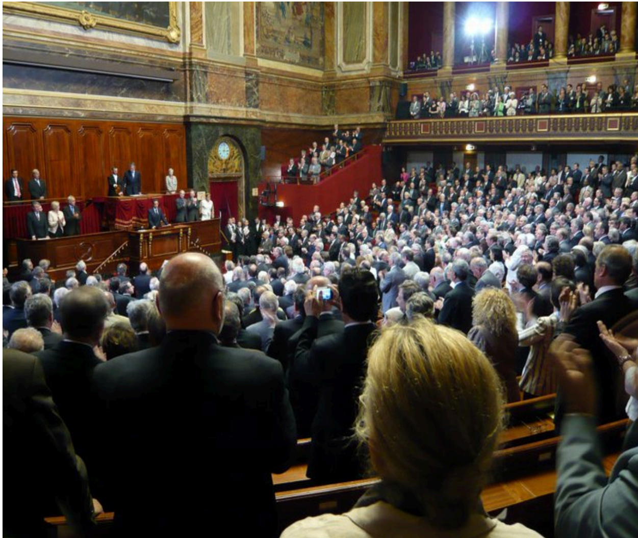
Les parlementaires réunis en Congrès à Versailles