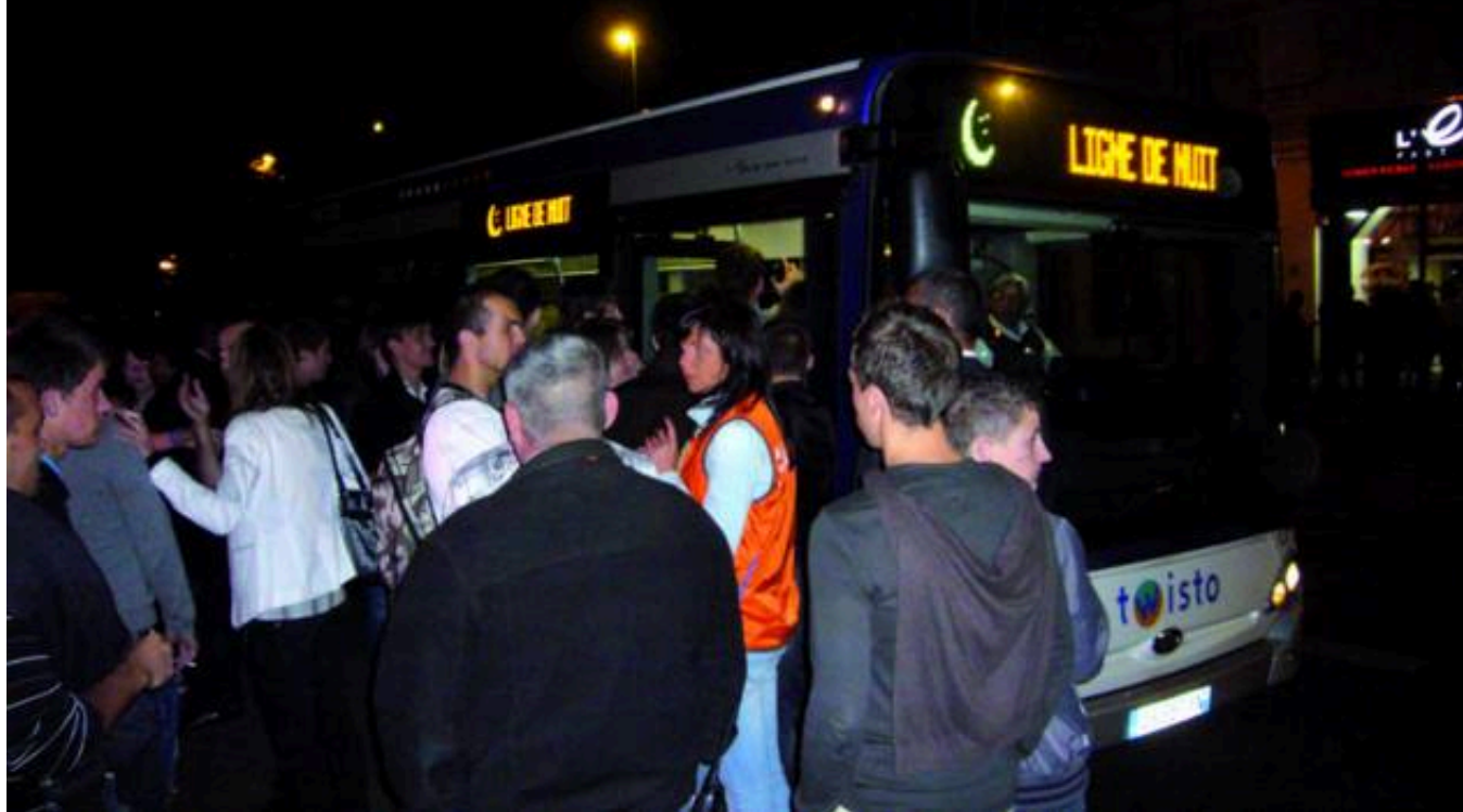
Travail de nuit pour les chauffeurs de bus