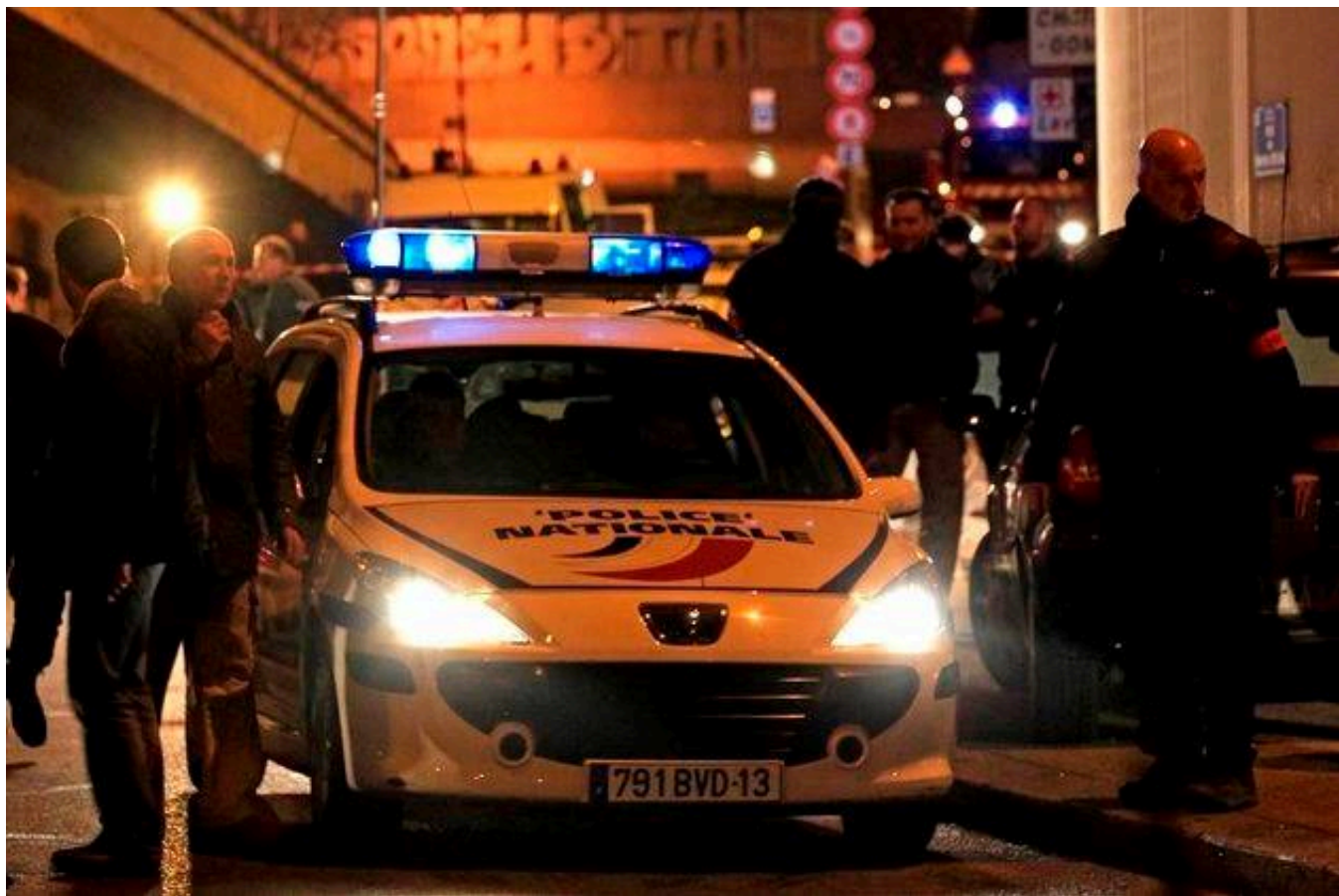
Travail de nuit pour les policiers

L'explosion du travail de nuit des femmes, conséquence directe des directives