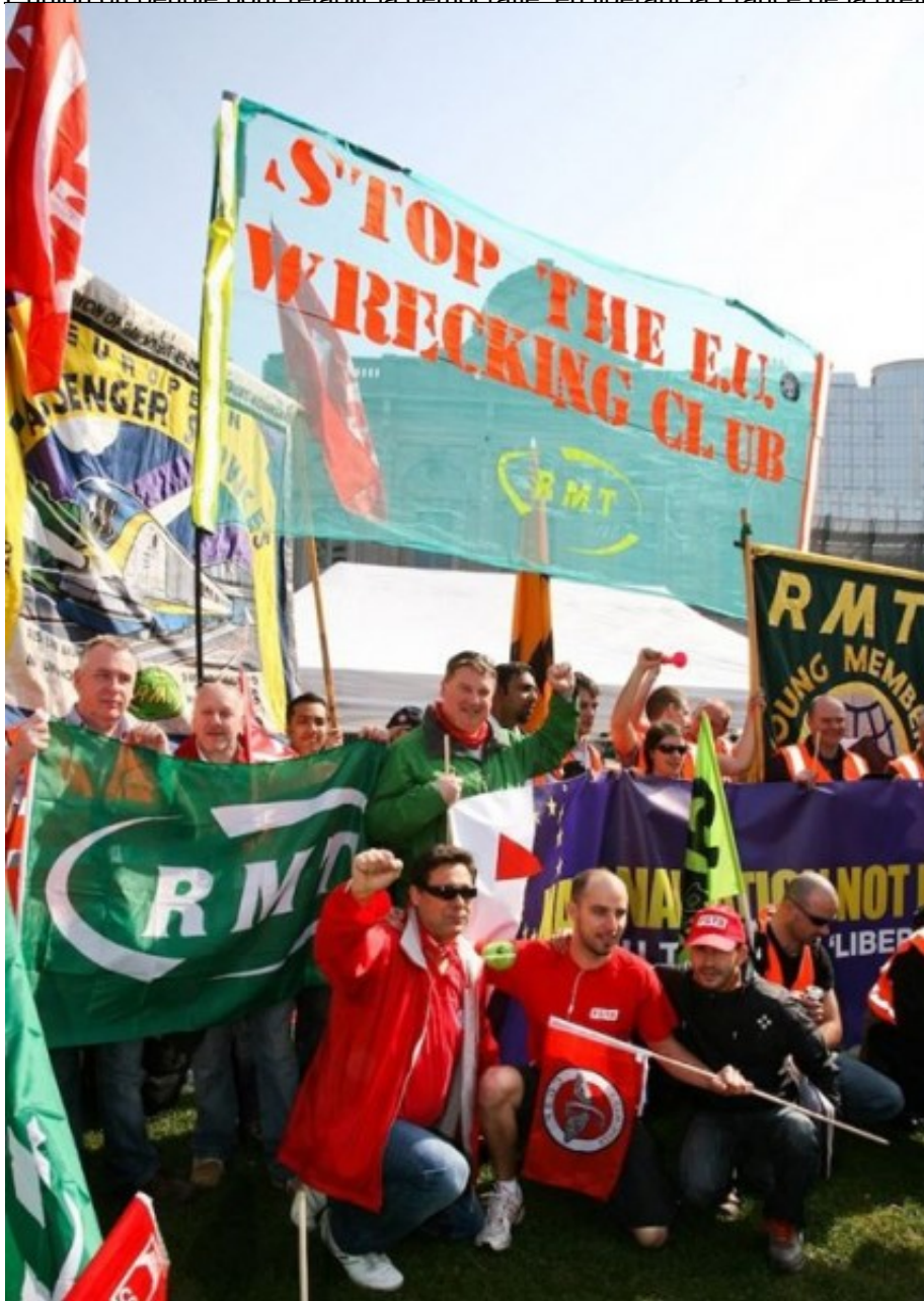
Sur cette banderole, on peut lire : « Arrêtons le club de naufrageurs de l'UE ! »