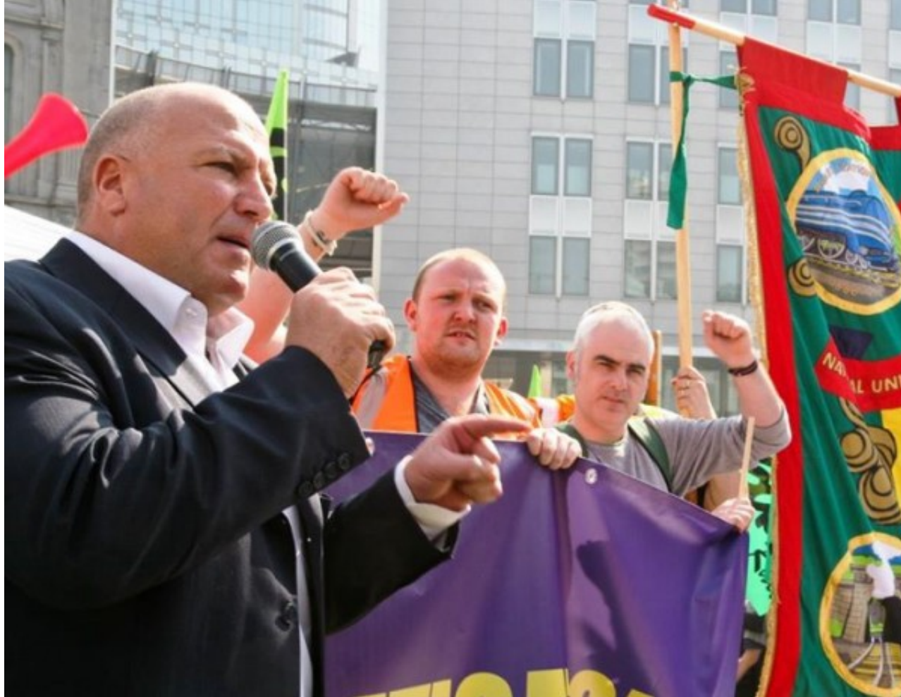
Le secrétaire général du RMT, Bob Crow, ici à gauche, s'adresse aux manifestants.