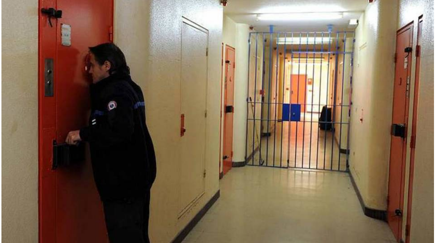
Prison de Ploemeur.