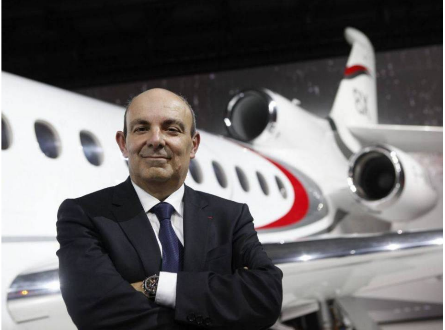
Éric Trappier, patron de Dassault.