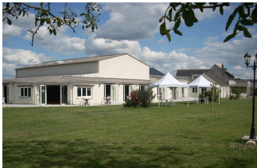
La Haute Salle, à Vallères