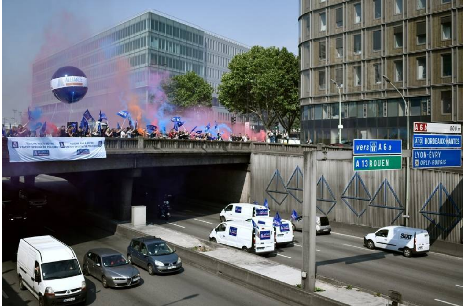
Opération escargot organisée par les syndicats policiers à Paris.